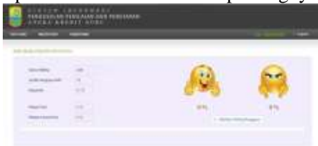
Gambar 10 Pooling Kepuasan pengunjung