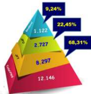
Gambar 1 Grafik Data Pegawai berdasarkan SIMPEG

Guru adalah pendidik profesional yang mempunyai tugas, fungsi, dan peran penting dalam mencerdaskan kehidupan bangsa. Profesi guru perlu dikembangkan secara terus menerus dan proporsional menurut jabatan fungsional guru. Selain itu, agar fungsi dan tugas yang melekat pada jabatan fungsional guru dilaksanakan sesuai dengan aturan yang berlaku, maka diperlukan Penilaian Kinerja Guru (PK GURU) yang menjamin terjadinya proses pembelajaran yang berkualitas.