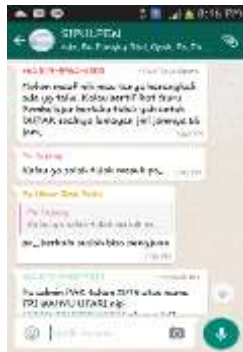
Gambar 12 Forum komunikasi operator di WA