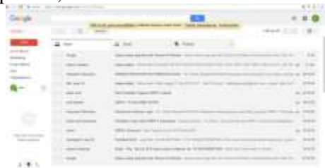
Gambar 11 E-mail komunikasi dan data