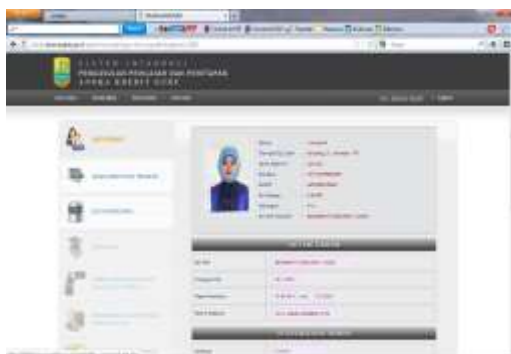
Gambar 6 Informasi PAK dan Profil guru