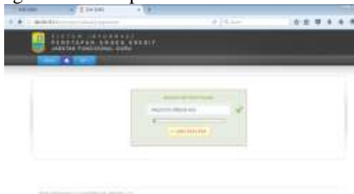
Gambar 4 Guru dapat mengecek usul PAK

Output bagi guru adalah dengan mengakses alamat silkbkd.karawangkab.go.id guru dapat mengetahui status penilaian PAK.