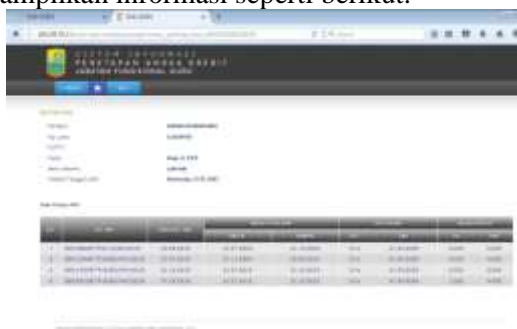
Gambar 5 Informasi Riwayat PAK

Apabila data yang dicari ditemukan maka akan ditampilkan informasi seperti berikut: