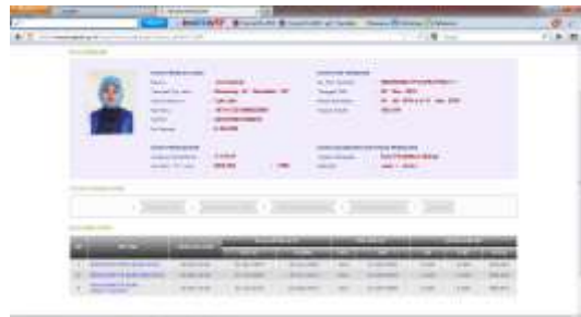
Gambar 7 Status usul DUPAK guru