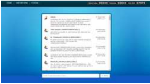
Gambar 9 Forum Komunikasi & Counter